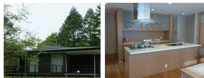
軽井沢『あさまテラス』

働きやすい職場環境づくりはもちろん、オフタイムの充実にも積極的に取り組んでいます。当社は、社員に職場を離れて仲間とのコミュニケーションの場やリフレッシュする時を提供する為に、福利厚生の一つとして緑あふれる軽井沢に保養所を用意しています。いつでも気軽に利用する事ができます。