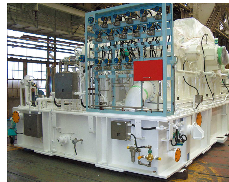
電材部品取付け例 (計装盤・端子箱・計器類)