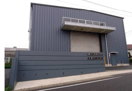
水木工場 (組立工場)